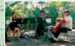
Zahlreiche, um den Stienitzsee ansässige Vereine bereichern den Lauf durch zusätzliche Aktionen.