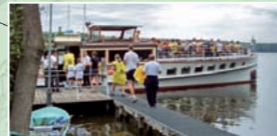
Der kostenlose Schiffs-Shuttle-Service über den Stienitzsee eröffnet den Gästen neue Ausblicke und belebt die strapazierten Körper.