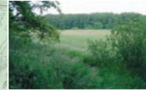
Der Halbmarathon führt auch um das Naturschutzgebiet »Lange Dammwiesen«.