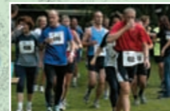
Für das leibliche Wohl wird an der Strecke und am Ziel gesorgt.