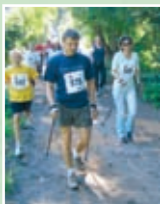
Gute sportliche Bedingungen und eine kompetente Betreuung finden auch die Nordic Walker.